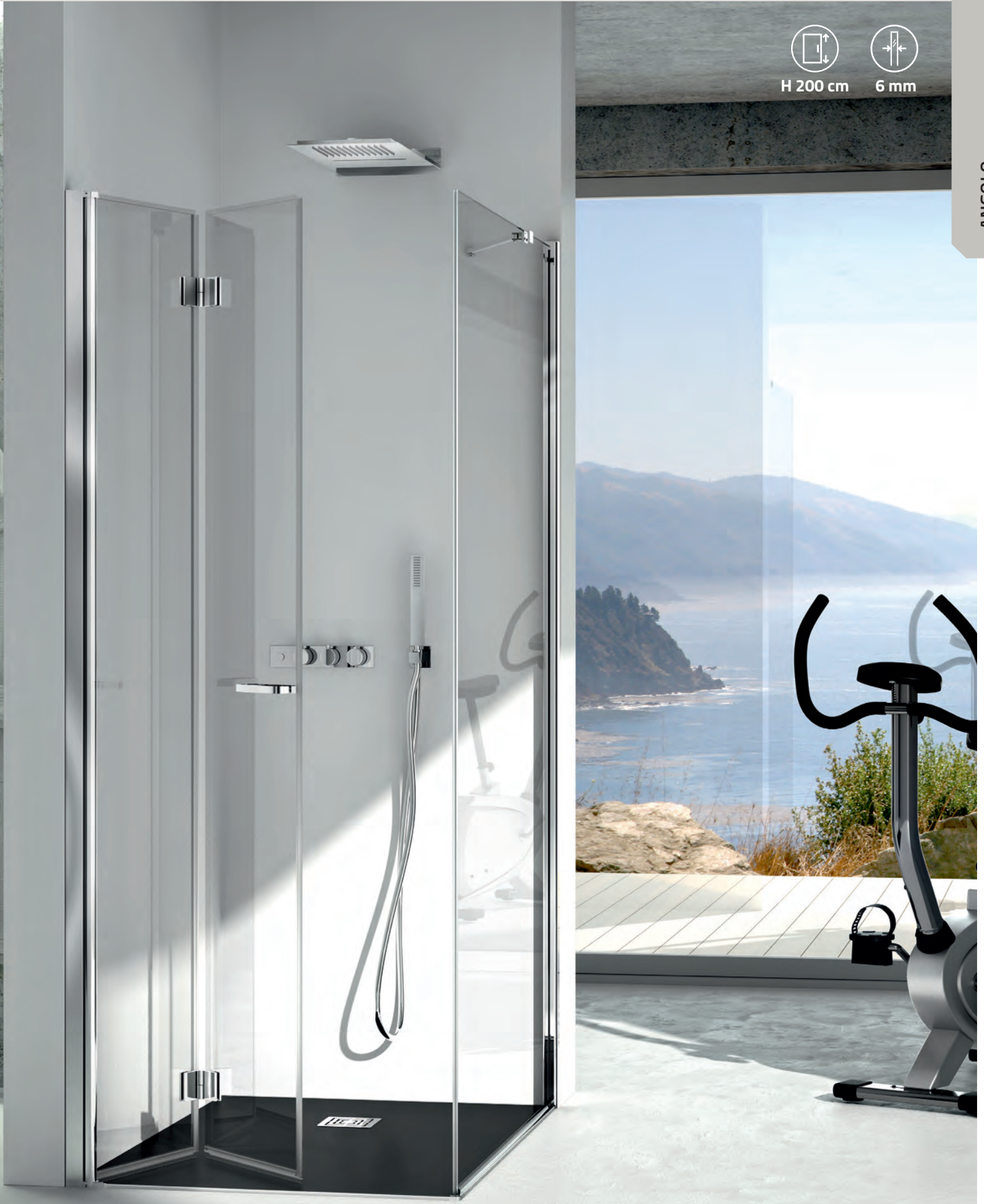
Piatto doccia Touchstone "Ardesia" Antracite