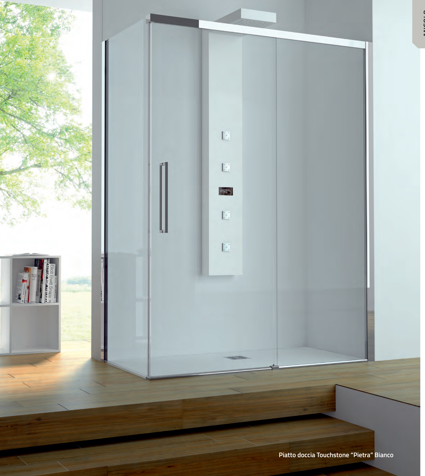
Piatto doccia Touchstone "Pietra" Bianco