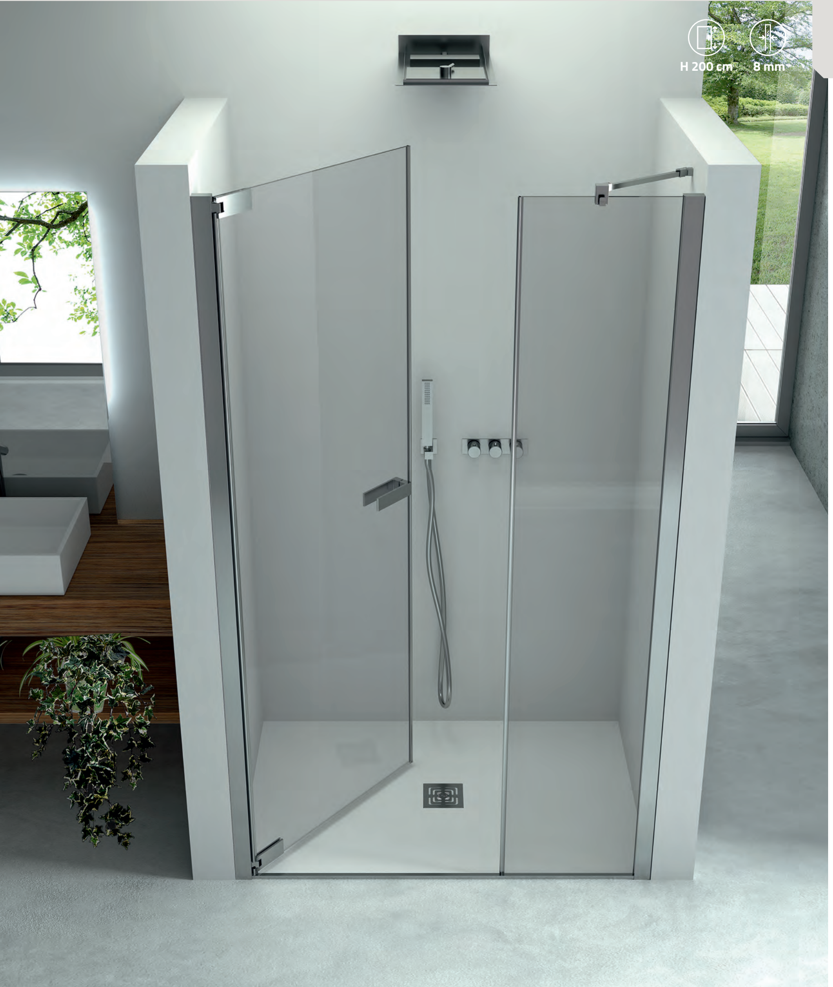
Piatto doccia Slim 2.6 Bianco