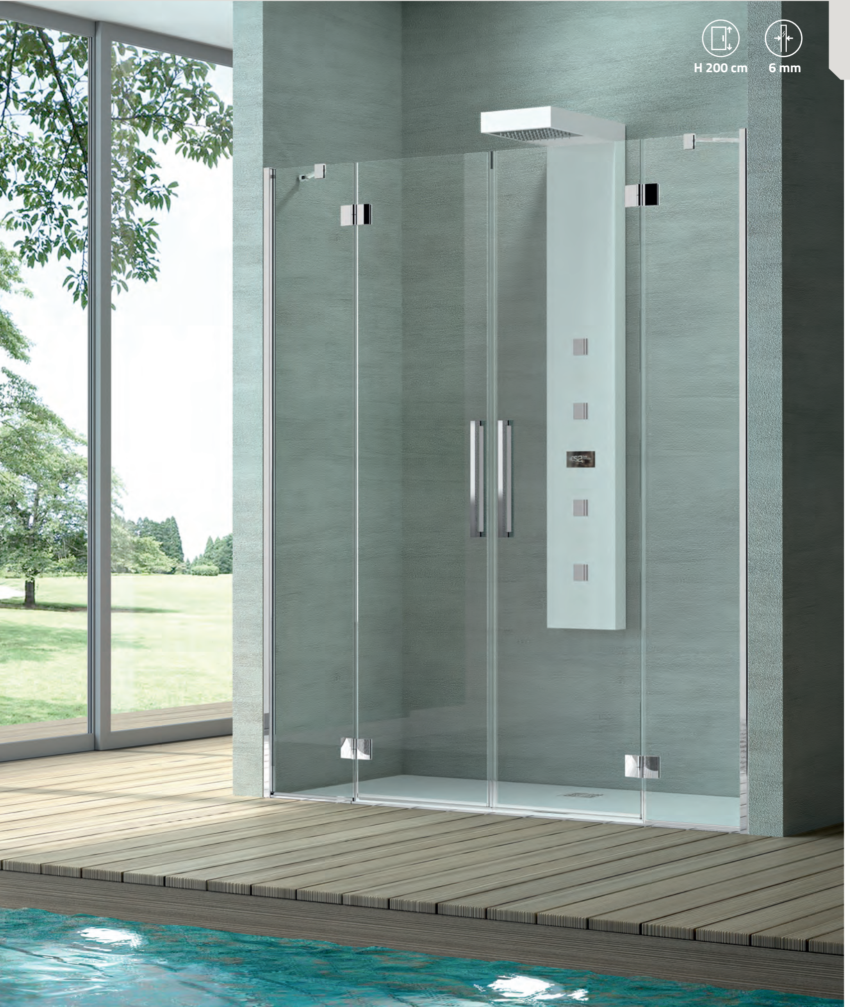
Piatto doccia Touchstone "Pietra" Bianco