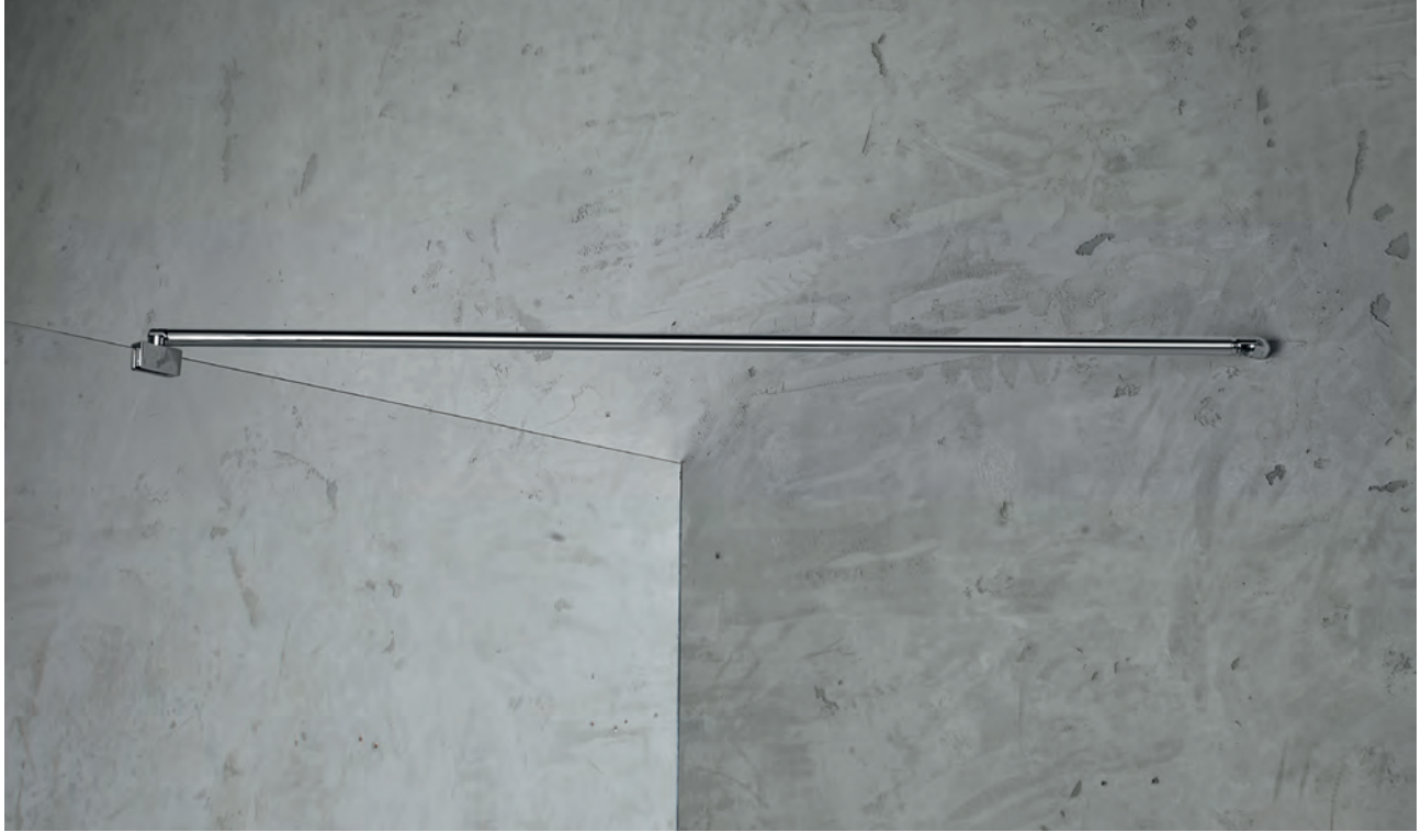
braccetto tondo muro-vetro con doppio snodo 180° cromo / cromo satinato L da 800 a 1200 mm Ø 16 mm -